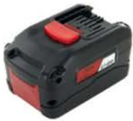
Li-Ion Akku, 5Ah 36V